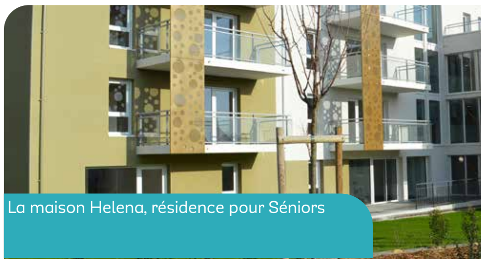
La maison Helena, résidence pour Séniors